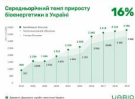
Рис. 1. Середньорічний темп приросту біоенергетики в Україні

Згідно даних Державної служби статистики України з Енергетичного балансу України за 2019 рік, у структурі виробництва енергії з відновлюваних джерел у 2019 р. найвагомішу частку займали біопаливо та відходи – 79,3%. Дані Держстату показують факт сповільнення розвитку сектору біоенергетики України. Так, обсяг виробництва біопалива та відходів становив 3786 тис. т н.е. у 2019 р. (проти 3726 тис. т н.е. у 2018 р.), а обсяг «загального постачання первинної енергії з біопалива та відходів» – 3362 тис. т н.е. у 2019 р. (проти 3208 тис. т н.е. у 2018 р.) (Рис. 1).